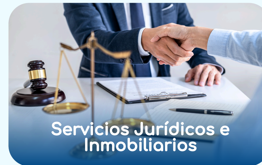
Servicios Jurídicos e Inmobiliarios