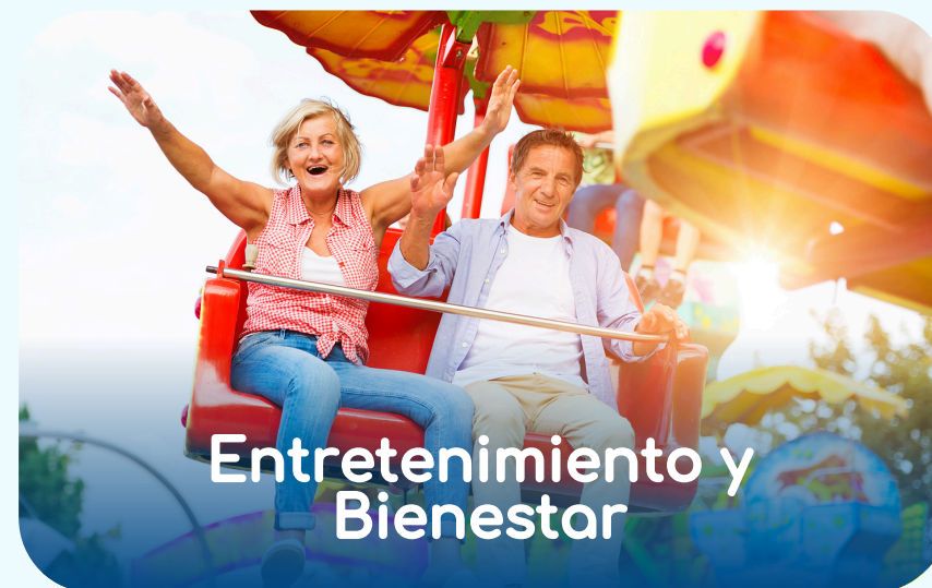
Entretenimiento y Bienestar