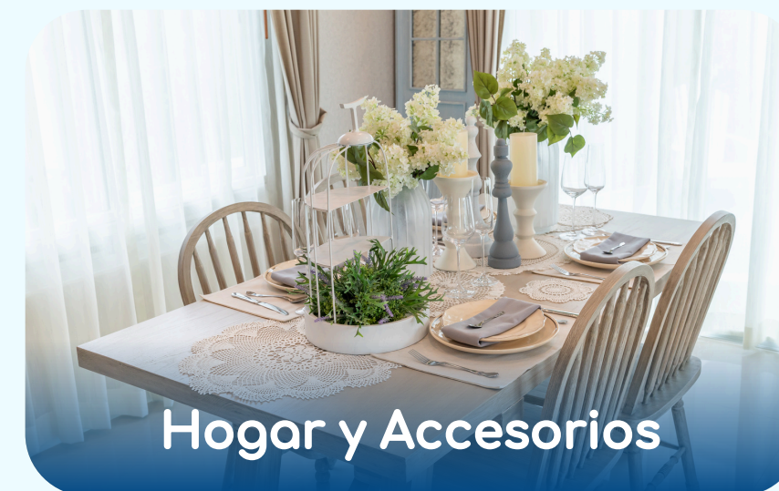
Hogar y Accesorios