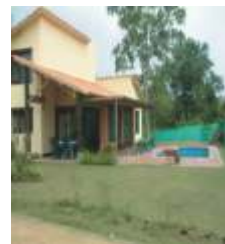
Panaca (Eje Cafetero)