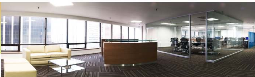
La sede será inaugurada por los Delegados a la Asamblea General, en representación de los asociados de todas las regiones del país.